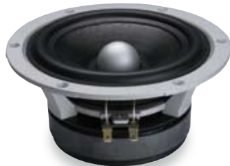
CW 175 A